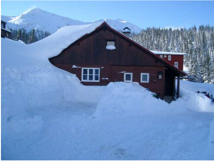
Hütte im Winter